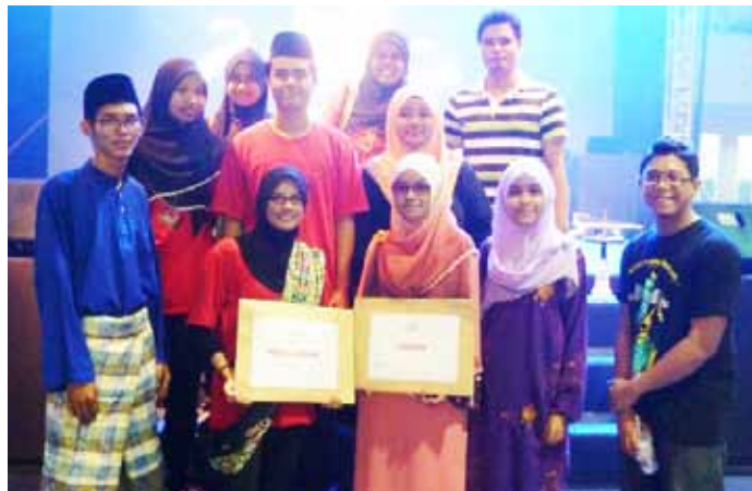
Kumpulan Gamelan Pelajar UMT dan Kumpulan Gamelan Pelajar Kokurikulum (Tahun 1) bersama hadiah yang dimenangi mereka.

Turut serta dalam pertandingan itu adalah kumpulan daripada UniSZA, UiTM (Chendering/ Dungun), Politeknik, Kolej Komuniti dan Kolej Teknologi Bestari.