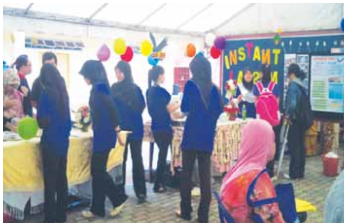
Pameran produk yang dijalankan oleh para peserta.